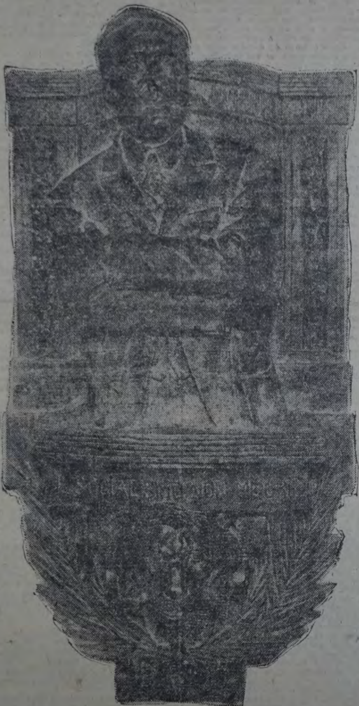
Busto de Matteotti — Obsequio de los grupos socialistas italianos residentes a la Casa del Pueblo

Centro de Avellaneda — En Sulpacha y Boursel, Villa Independencia (Sarandí), a las 9.30. Orador: diputado provincial Jerónimo Della Latta.